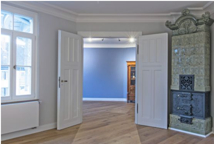
7–9 Der Stuck wurde in diesen Innenräumen restauriert und teilweise auch rekonstruiert. Ausgeführt wurden auch Abriss- und Mauerarbeiten, ebenso alle Malerarbeiten (spachteln, lackieren und streichen). Das Farbkonzept wurde in Abstimmung mit den Auftraggebern entwickelt.