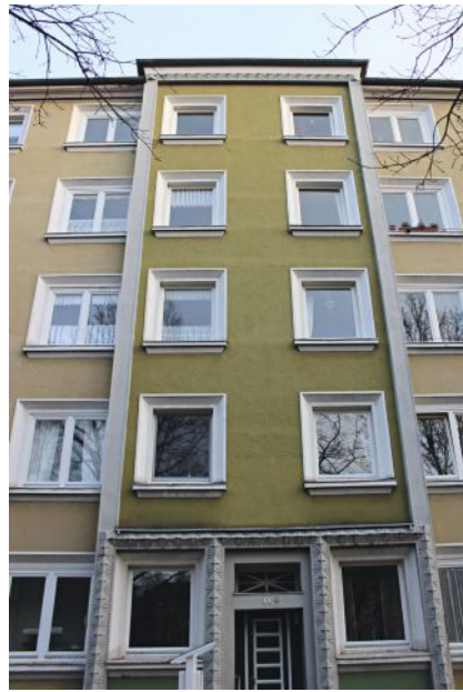
3+4 Vorher/nachher. Die Fassade dieses Mehrfamilienhauses wurde rekonstruiert. Für die Risalit-Einfassung erfolgten Abform- und Gussarbeiten mit Romankalkmörtel.